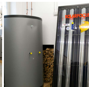
Besichtigt werden können ein Pufferspeicher und ein Solarmodul