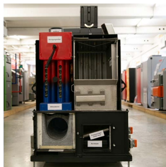
Aufgeschnittener Scheitholz-Kessel mit Wirbulatoren, Brennkammer, Rost usw.