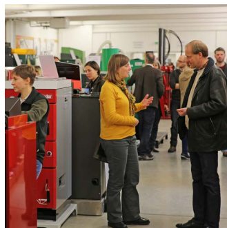
TFZ-Fachexperten beraten Besucher unabhängig und produktneutral