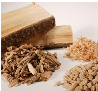
Verschiedene Holzbrennstoffe werden beim Heizen eingesetzt

Im Vortrag erläutert Lesche die Qualitätsmerkmale der Brennstoffe Scheitholz, Hackschnitzel und Pellets. Zudem wird ausführlich darauf eingegangen, auf was beim Betrieb von Kaminöfen und Zentralheizungen in Wohngebäuden zu achten ist. Dazu gehören Funktionsweise und Aufbau verschiedener Anlagen- und Ofentypen, Hinweise zur effizienten und emissionsarmen Bedienung, räumliche Voraussetzungen sowie rechtliche Vorgaben zu Emissionen.