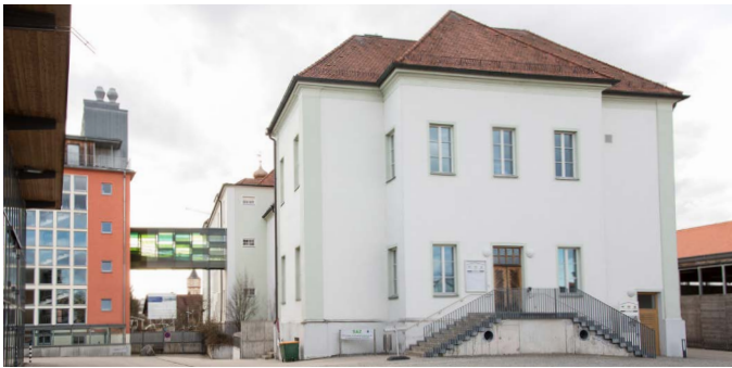
Das SAZ mit Eingang im Innenhof

Schulungs- und Ausstellungszentrum (SAZ) Schulgasse 18 94315 Straubing