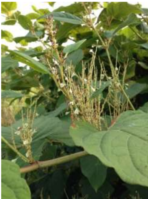
Abbildung 1: Samen an einer IGNISCUM®-Pflanze

Sachgebiet Rohstoffpflanzen und Stoffflüsse Technologie- und Förderzentrum (TFZ)