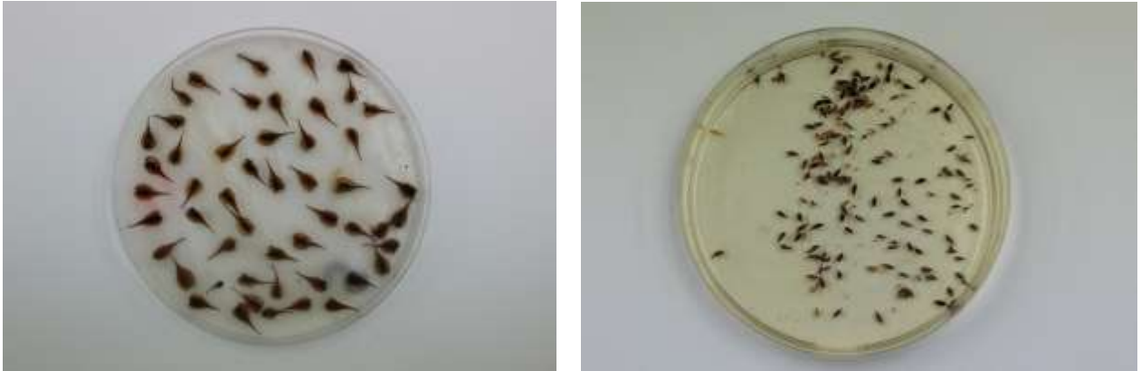
Abbildung 2: Keimfähigkeitstest (links) und TTC-Test mit den halbierten IGNISCUM ® -Samen (rechts)

Zeitgleich wurde die Lebensfähigkeit der Samen geprüft. Lebensfähige Samen, die eine geringe Keimfähigkeit aufweisen, deuten auf eine mögliche Keimruhe (Dormanz) des Saatguts hin. Zur Feststellung wurde ein Triphenyltetrazoliumchlorid-Test (TTC) durchgeführt (Abbildung 2). Dafür wurden 69 reife und 112 unreife Samen getrennt voneinander für 12 h in einer Petrischale auf nassem Filterpapier ausgelegt. Den gequollenen Samen wurden anschließend die „Flügel“ entfernt, um das Samenkorn freizulegen. Mit einem Skalpell wurden die Samen nun, teils unter dem Mikroskop, halbiert, sodass der Embryo im Inneren sichtbar wurde. Die präparierten Samenhälften wurden mit einer Lösung aus 20 ml Wasser und 0,2 g Triphenyltetrazoliumchlorid in einer Petrischale aufgegossen bis sie vollständig bedeckt waren. Da die Lösung stark lichtempfindlich ist, wurden die Petrischalen anschließend in Alufolie eingewickelt. Bei der Samenkeimung wird durch die Atmung Energie in Form von Reduktionsäquivalenten (z.B. \text{NADH} + \text{H}^+ ) bereitgestellt. Gibt man den gequollenen Samen in die Lösung des Wasserstoffakzeptors Triphenyltetrazoliumchlorid, wird dieser durch die Reduktionsäquivalente zu rotem, wasserunlöslichem Formazan reduziert. Der Embryo lebensfähiger Samen färbt sich dadurch rot. Nach 24 h wurden die Samen deshalb erneut unter dem Mikroskop betrachtet.