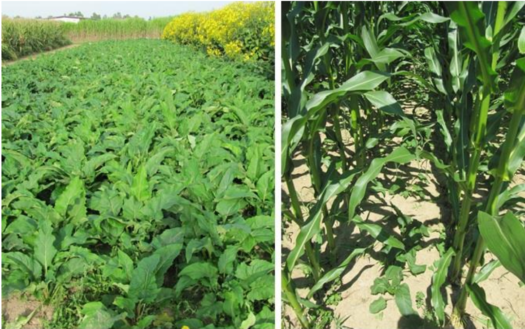
Abbildung 3: Einjährige Silphiebestände im Etablierungsjahr 2017: links Reinsaat am Standort Straubing mit kräftig entwickelten über 50 cm hohen Jungpflanzen, Saattermin 23.05.2017; rechts schwach entwickelte Jungpflanzen als Untersaat am Standort Wolferkofen, Saattermin 18.05.2017

In einem anderen Versuch wurde die Silphie am Standort in Straubing in Reinsaat im Jahr 2017 etabliert. Der Standort Straubing besitzt nahezu gleiche klimatische und geologische Standortbedingungen wie Wolferkofen, die Entfernung der beiden Standorte beträgt ca. neun km. Dies ermöglicht es, einen Vergleich zu ziehen. Im Unterschied zu der als Untersaat etablierten Variante hatte der Straubinger Reinsaat-Bestand im Etablierungsjahr keine Konkurrenz durch eine Deckfrucht. Bereits im Jahr 2017 entwickelte sich nur durch die Rosetten ein üppiger Bestand mit Reihenschluss. Der Unterschied in der Jungpflanzenentwicklung wird in Abbildung 3 ersichtlich. Der Aufwuchs war nach kräftigem Wiederaustrieb im Jahr 2018 relativ früh geschlossen und konnte Unkräuter effektiv unterdrücken.