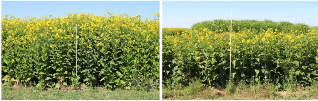
Abbildung 4: Zweijährige Silphiebestände im Jahr 2018: links Etablierung in Reinsaat am Standort Straubing, Saattermin 23.05.2017; rechts Etablierung als Untersaat am Standort Wolferkofen, Saattermin 18.05.2017