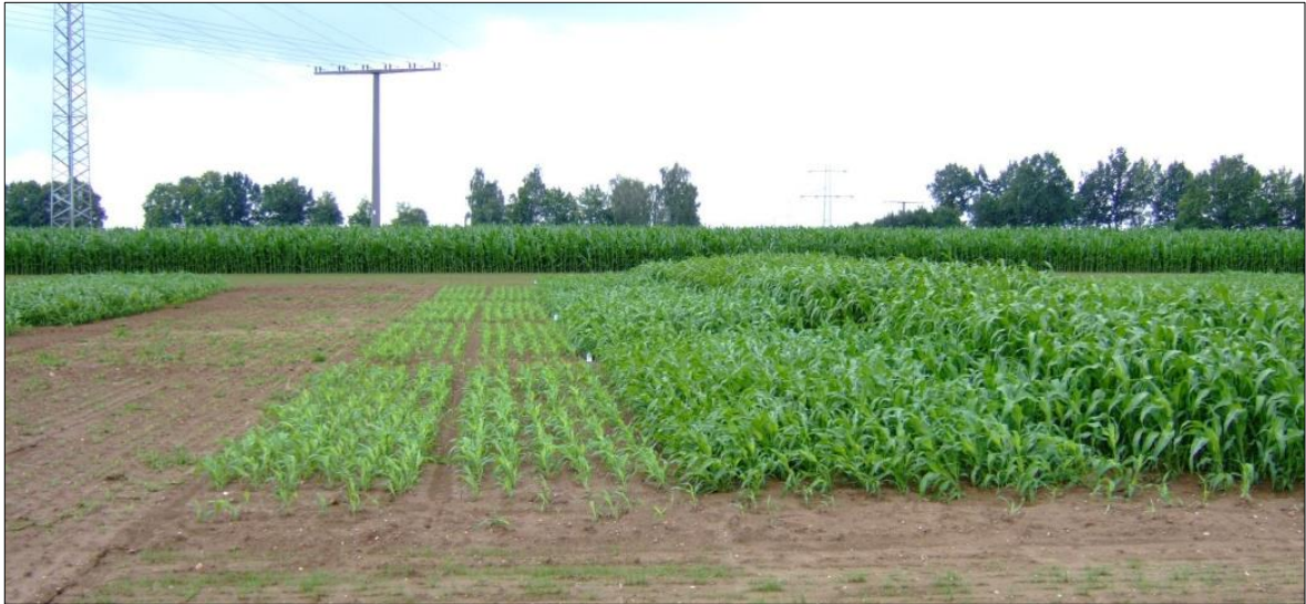
Foto: Sorghum-Parzellenversuch mit unterschiedlichen Saatterminen in Straubing (Saattermin von links nach rechts: Mitte Juni, Anfang Juni, Mitte Mai, Anfang Mai)

Dieses Merkblatt wurde als Beitrag im Bayerischen Landwirtschaftlichen Wochenblatt veröffentlicht: Ausgabe 17/2013