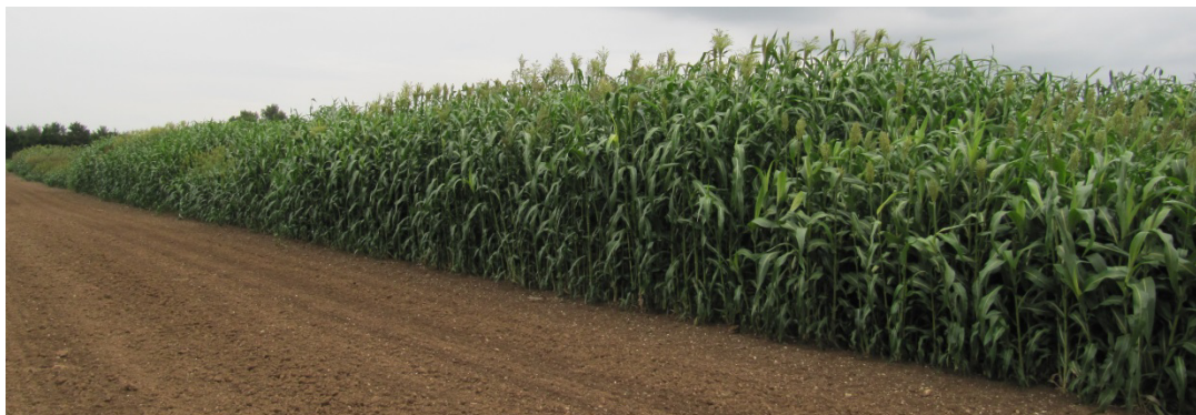
Abbildung 2: Blick entlang des Sortenscreenings Anfang September 2015

Die einzige im Screening enthaltene Pennisetum glaucum -Sorte ADR 500 Super Massa brachte mit gut 170 dt TM/ha einen akzeptablen Ertrag bei sehr guter Standfestigkeit, allerdings blieb der TS-Gehalt von nur 21 % hinter den Erwartungen zurück.